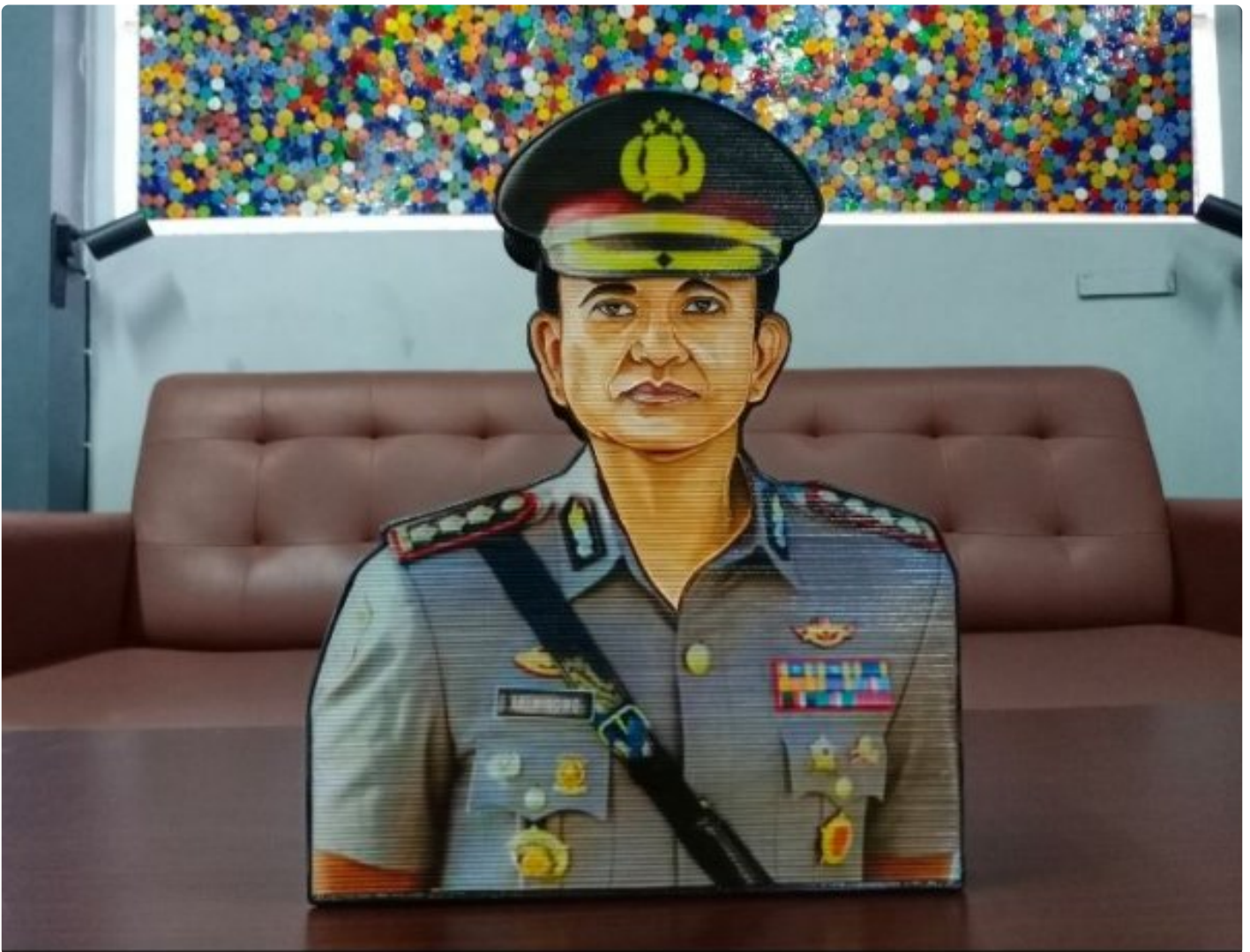
WBP Lapas Purwokerto Manfaatkan Kertas Bekas untuk membuat Celengan Karakter

PURWOKERTO - Warga Binaan Pemasyarakatan (WBP) Lapas Kelas IIA Purwokerto memanfaatkan kertas bekas untuk membuat kerajinan berupa celengan karakter, pada Rabu (23/10/2024).