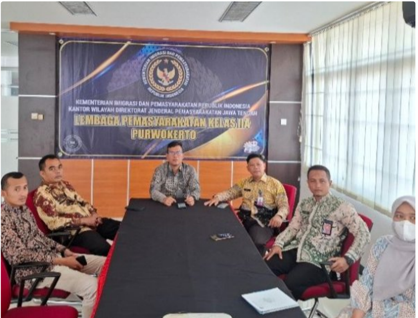
Lapas Kelas IIA Purwokerto Ikuti Entry Meeting Pemeriksaan BPK RI Atas Laporan Keuangan Kementerian Hukum dan HAM Tahun 2024 secara Virtual

PURWOKERTO - Lembaga Pemasyarakatan (Lapas) Kelas IIA Purwokerto mengikuti Entry Meeting Pemeriksaan atas Laporan Keuangan Kementerian