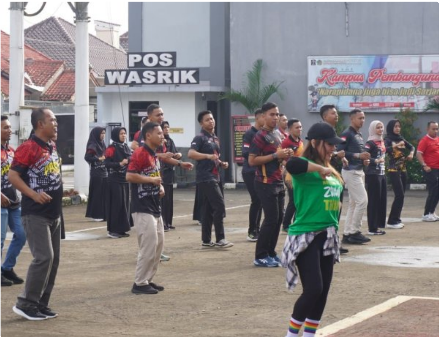
Jaga Kebugaran Tubuh, Pegawai Lapas Kelas IIA Purwokerto Senam Pagi Bersama

PURWOKERTO - Kegiatan senam pagi ini dilaksanakan di halaman gedung utama yang dimulai pukul 07.45 yang dipandu oleh instruktur profesional. Kegiatan ini diikuti oleh Kalapas dan seluruh pegawai Lapas Kelas IIA Purwokerto, pada Sabtu (25/1/2025).